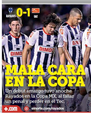
Un debut amargo tuvo anoche Rayados en la Copa MX, al fallar un penal y perder en el Tec.