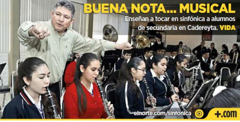
BUENA NOTA... MUSICAL Enseñan a tocar en sinfónica a alumnos de secundaria en Cadereyta. VIDA