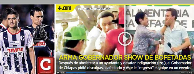
Después de abofetear a un ayudante y desatar indignación (izq.), el Gobernador de Chiapas pidió disculpas al afectado y éste le "regresó" el golpe en un evento.